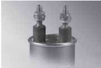
C6/C68 端子 (対応ケース径：φ60～136mm)