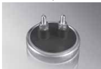
G1 端子 (対応ケース径：φ50/55/65mm)